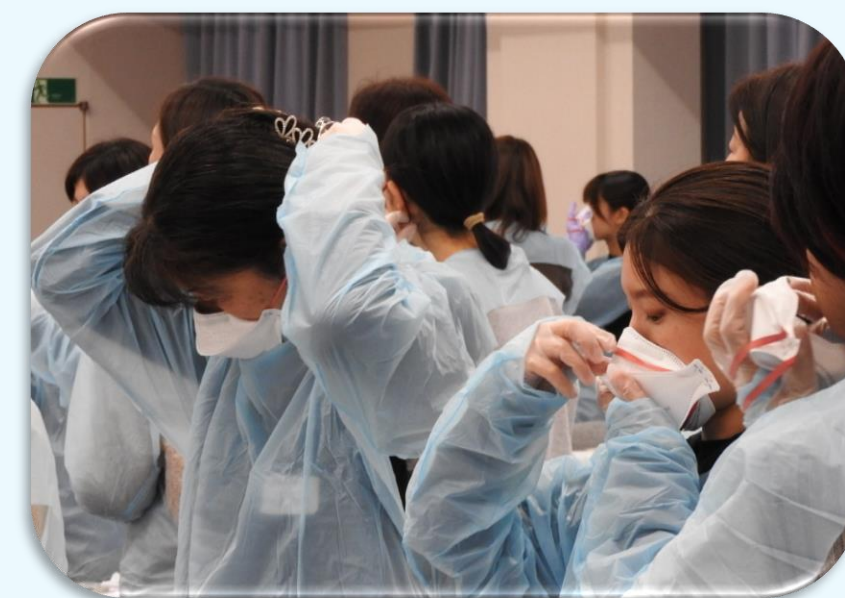
手順にそってPPE装着

R6年4月から災害支援ナースの仕組みが変わり、これまでの「災害時の派遣」に加えて、「新興感染症発生・まん延時の派遣」も対応することとなりました。災害支援ナースは「災害・感染症医療業務従事者」として法的に位置付けられます。