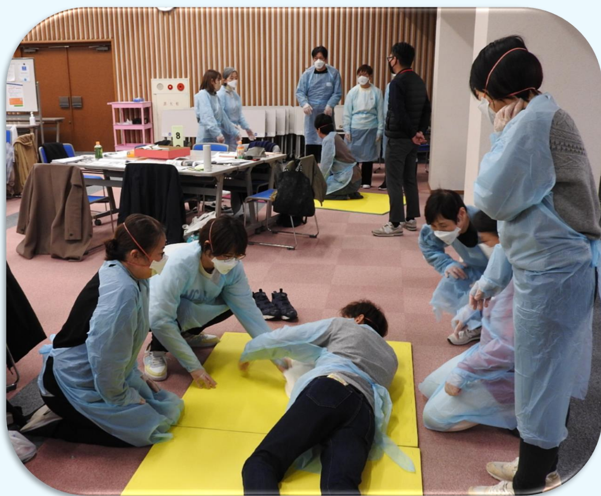
安楽な呼吸を保つための ポジショニング