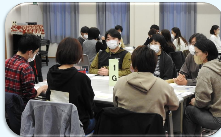
グループワークの様子