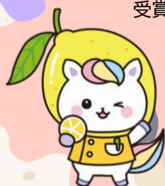
広島県かんごちゃん

広島県かんごちゃん賞として、若干名に賞状、副賞を授与 応募者全員に参加賞を送ります。 開催日: 令和7年5月18日(日) 会場: 広島国際会議場 受賞者には令和7年4月下旬に広島県看護協会事業部よりご連絡いたします。 お問い合わせ・送付・持参先