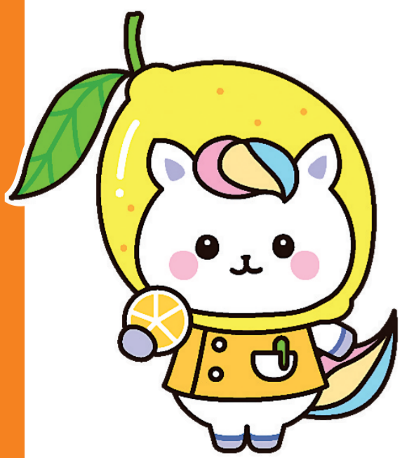
広島県かんどちゃん