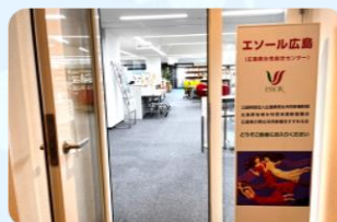
〈 10階入口 〉

エソール広島に入られましたら、 「研修室1」へ直接お越しください。 音漏れを防ぐため、 扉を閉めています。 扉を開けてお入りください。