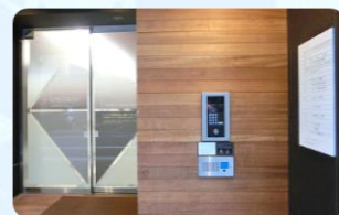
〈 1階 入口インターホン 〉