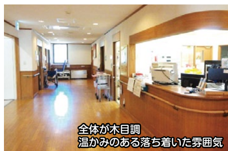
全体が木目調 温かみのある落ち着いた雰囲気

当院は、50床の医療療養型の病院です。病棟は全体が木目調になっており温かみのある落ち着いた雰囲気になっております。