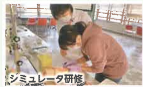
シミュレータ研修

広島県看護協会20回、市立三次中央病院1回、サテライト福山8回、シミュレータを使って採血・吸引等の技術研修を実施しました。