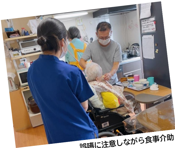
誤嚥に注意しながら食事介助