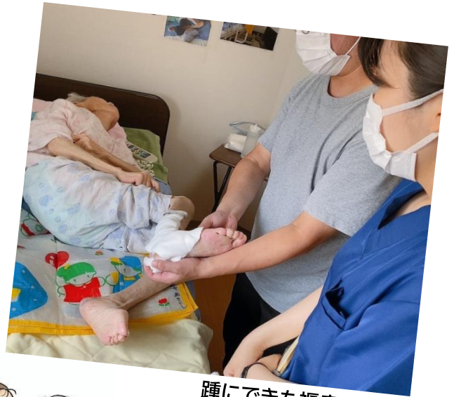
踵にできた褥瘡の処置