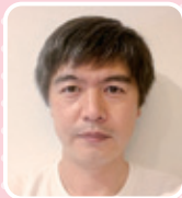
財務 坂根 通之 医療法人社団恵直会 竹原病院