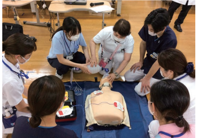
多職種で行ったBLS研修

これに伴い、看護部は看護部理念を掲げ、基本方針に沿って教育体制を整え、平成21年には自律を目指す看護師育成キャリアパスとジェネラリストラダーを作成しました。平成25年からは専門看護師、認定看護