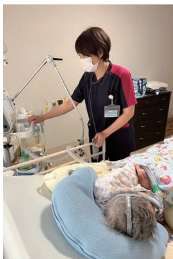
非侵襲的陽圧換気の設定変更①