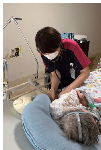
非侵襲的陽圧換気の設定変更②