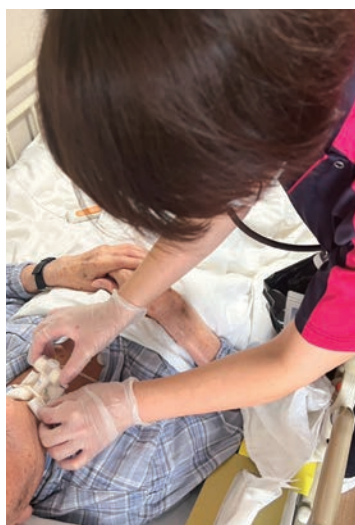
気管カニューレの交換