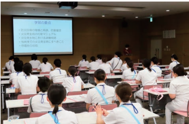
災害看護研修風景

これからも災害拠点病院としての役割を果たすため、新病院における新たなBCP(事業継続計画)を策定するとともに、有事に備え災害時医療の円滑な遂行を目指していきます。