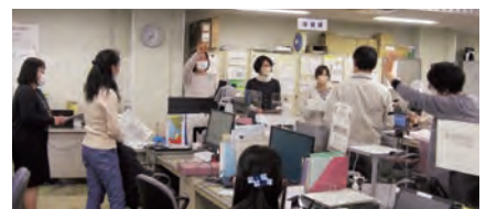
所内ミーティング

や感染症のまん延防止、重症化予防に職員一丸となって取り組んでいきたいと思ひます。