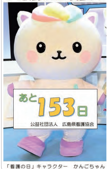
「看護の日」キャラクター かんごちゃん