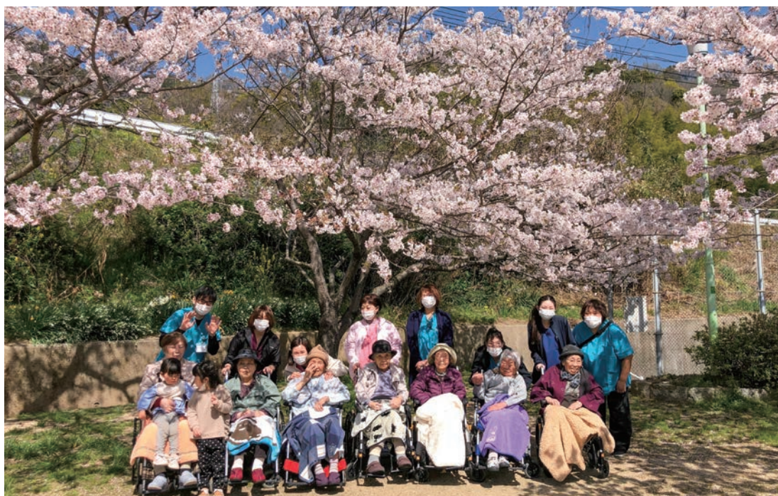
看多機で近くの公園へお花見