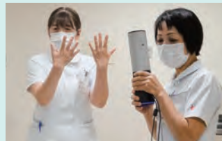
病院から手指消毒実践を配信中