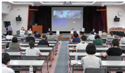
シンポジウムの様子

の意見がありました。今後も、医療安全管理者の活動に活かせる意見交換会を考えていきたいと思ひます。