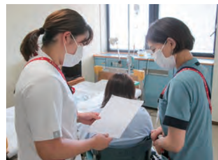
看護職員から看護補助者への指示場面 紙面を用いた指示出しで、患者・指示内容を正確に伝える。