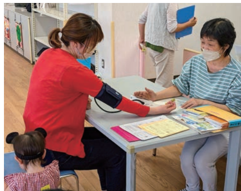
まちの保健室 西保健センター会場