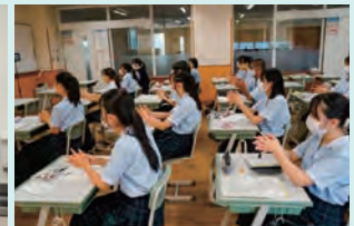
参加者が手指消毒実践中