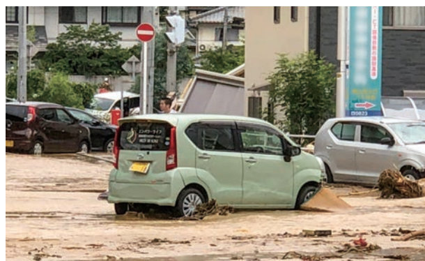
廃車になったグリーンの社用車

なっています。ご自宅へ出向く訪問看護、また人が集まる看多機。自分自身また家族の発熱により、休みを取らざるを得ないスタッフと出勤者の双方に心身の負担が続いています。身体的な面に加えて経済的な面、そして心理的な面。この状況を乗り越えるために自問自答して出した答えは豪雨災害で学んだ「人とのつながり」です。事業所内外また利用者様家族での情報共有、お互い様の精神でのスタッフ同士のフォロー体制、そして事業所としてできる対応を説明した上で利用者様家族への協力をお願い。「人とのつながり」でウィズコロナの社会を創っていきましょう。エンパワーライフは「住みなれた地域で最期まで過ごしたい」を実現するために「人とのつながり」をこれからも大切にしていきます。