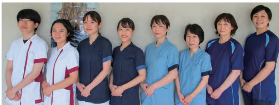
当院看護部のユニフォーム 左より、日勤看護師(白)、夜勤看護師(紺)、看護補助者(水色)、看護補助者(浴室用介助着)

繋げています。看護補助者委員会では、小さな意見も拾い上げ、今年度は、浴室用介助着の導入や、全体研修だけでなく、要望に応じた部署研修も実施しています。これからも、対話と教育を充実させ、タスク・シフト/シェアに取り組んでいきたいと思ひます。