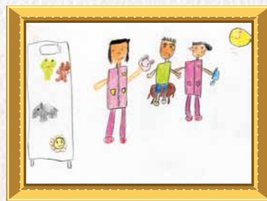
1年生 凝重 果奈