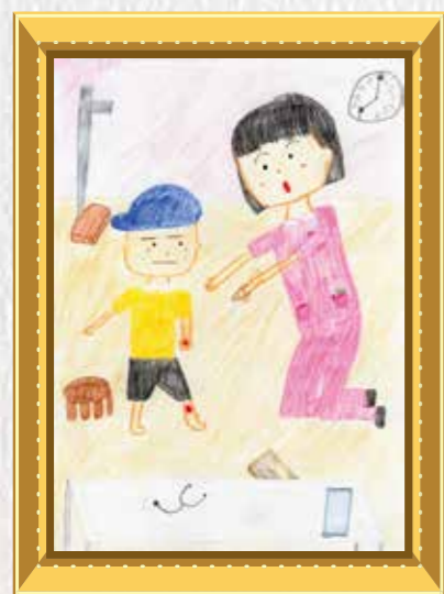
5年生 凝重 咲良