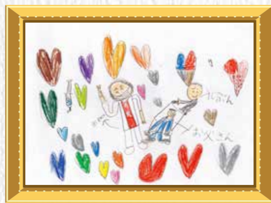
2年生 石根 成将