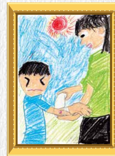
4年生 梅本 善治