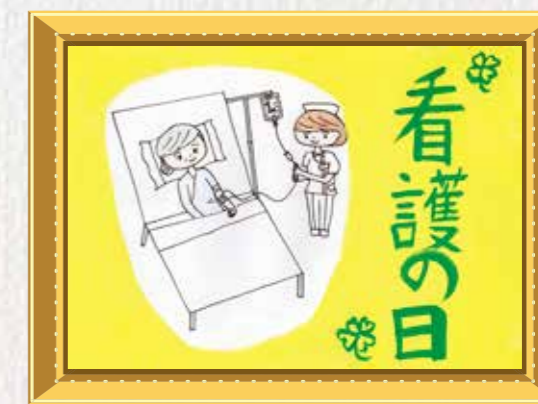
5年生 竹川 つばさ