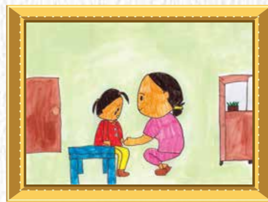
5年生 上田 蓮介