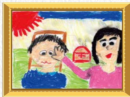
1年生 梅本 智治