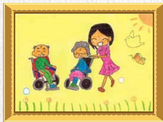
4年生 上田 美優