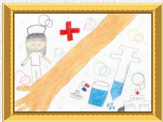
5年生 石崎 未来