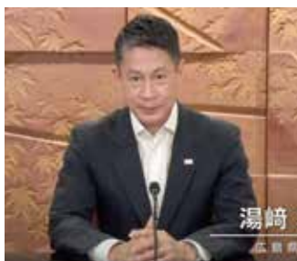
湯崎広島県知事ビデオ挨拶