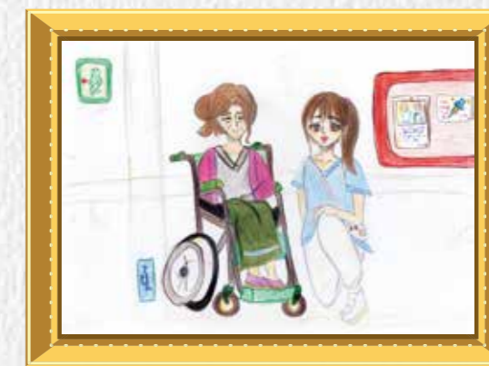
4年生 上田 愛菜