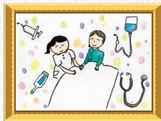
2年生 粟村 結菜