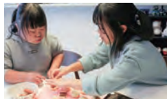
チョコパンとウインナーパンを創作中