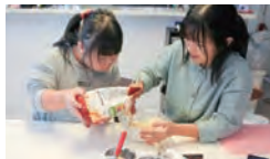
分量なんて…気にしません!

我が家のパン作りのモットーは「出来栄なんて気にしない、とにかく楽しく!」です。大雑把な私とスーパーポジティブな長女、天真爛漫な次女の3人で作るパンは、どこで間違えるのか全然膨らまなかったり妙に歯ごたえがあったり…。なんて事もあります。娘2人とおしゃべりしながらのパン作りは、私にとって心地よく気持ちが癒される時間です。