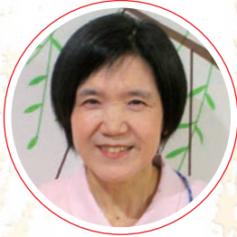
重松 公保 総合病院 三原赤十字病院