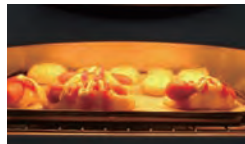
美味しい匂いがたまりません♪