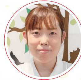
安岡 恵 総合病院 三原赤十字病院