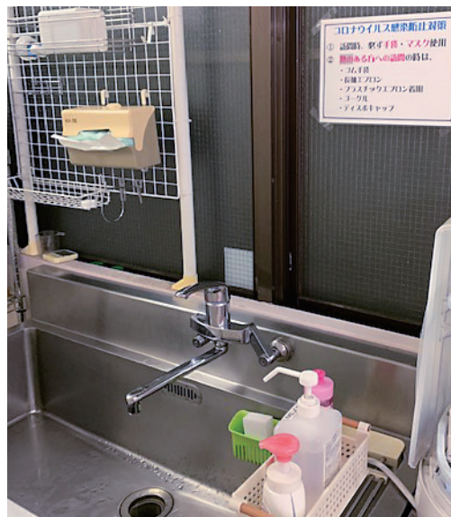
職員出入り口(裏口)の手洗い場