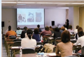
左(上下とも)：新型コロナウイルス感染症研修会 中：フィジカルアセスメントー呼吸ー 右：看護研究のサポート

今年度も、コロナ禍で支部運営に影響もありますが、感染対策に留意し研修会を開催しております。5月は「新型コロナウイルス感染症」、7月は「フィジカルアセスメントー呼吸ー」を実施しました。また、看護研究のサポートも2施設行っています。制限された人数やプログラムになりますが、参加者からは、「知識が深められた」「頑張ってる看護研究に取り組みたい」という声が聞かれました。少しずつですが支部活動も活気づいています。