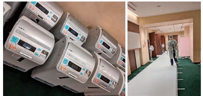
酸素センターの様子（左右とも）

この「業務従事者届」を始め、「職場環境づくり実態調査」や「離職者実態調査」は、県の事業の方向性を検討する際の基礎データとなります。回答数が多いほど、データに実態が正確に反映されますので、今後とも、調査への御協力をお願いします。