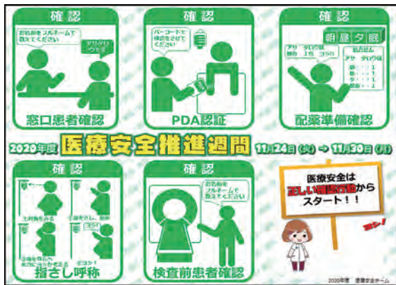
医療安全推進週間ポスター