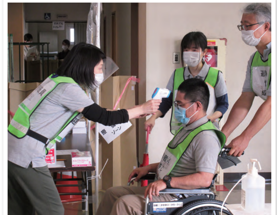
避難所開設訓練における事前受付(検温)の様子