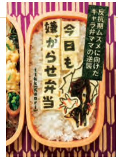
『今日も嫌がらせ弁当』 作・Kaori(ttkk)

皆さんも毎日忙しい日々の中、笑えて、泣けて、少し前向きになれる本はいかかでしょうか？