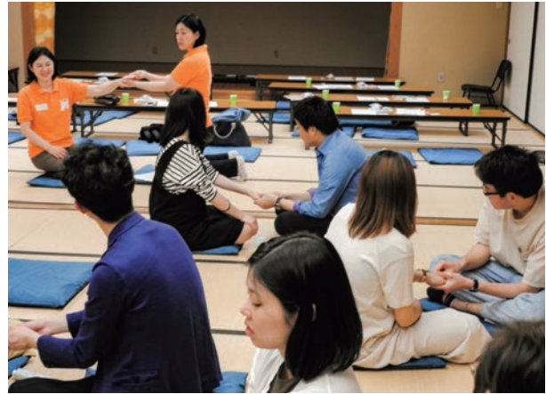
夫婦で楽しくハンドマッサージ中

と一緒にパパも支えたいと始めたこの育児教室も3回目となり「助産師から直接色々なアドバイスを聞いて良かった」「ネットや本では実感しにくい事も分かりやすかった」などの声も聞かれ、参加された妊婦さんやご家族の笑顔があふれる“ひととき”になりました。