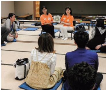
恒例の絵本の朗読に集中して聞かれる参加者

5月11日に「国際助産師の日」記念行事として、「目指せイクメン! パパとママの育児教室」を行いました。当日は、7組のご夫婦とその家族、16名が参加されました。まず産前産後のパパの役割について説明後、DVD「うまれる」を鑑賞しました。初めての試みでしたが、妊婦さんの中には出産シーンに感動し涙ぐむ方もおられました。その後、パパに妊婦ジャケットを着てもらい、妊婦の体験や、赤ちゃん人形を使い着替えや抱っこをしてもらいました。またハンドマッサージや胎