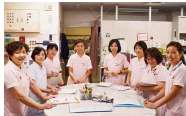
2病棟ナースステーション

ます。現在は2ヶ月ごとに開催し8回を終了していますが、最近では「次のN-カフェはいつですか?」と聞かれることもあり、カフェを待たずに面談を行っています。