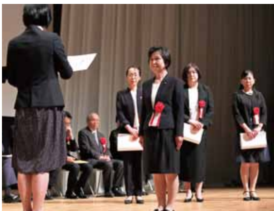
広島県看護協会会長表彰