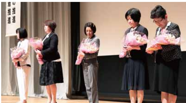
退任される役員の方々