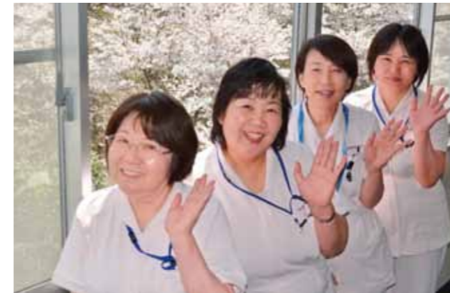
西村看護部長(左から2番目)と各病棟課長