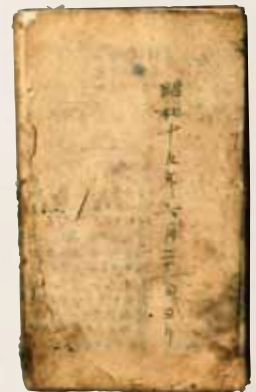
1945年8月6日の助産記録。