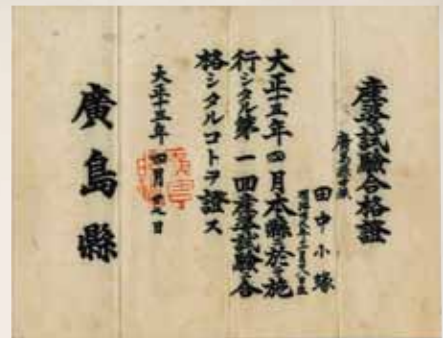
小蛸さんが受けた第一回産婆試験の合格証。1926(大正15)年4月27日付。