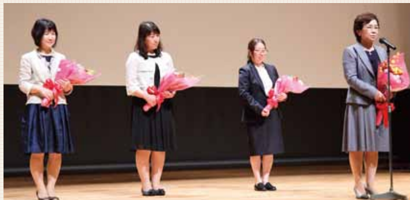
退任される役員の方々